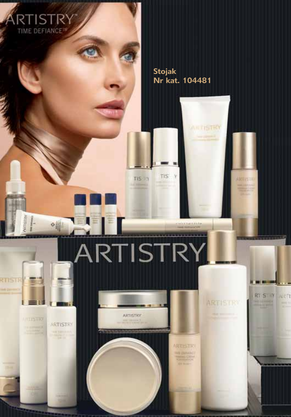
Stojak Nr kat. 104481

Wykorzystaj stojak z serii TIME DEFIANCE, aby zaprezentować kosmetyki z tej serii. Kiedy podczas prezentacji będziesz objaśniać klientom zalety płynące z wykorzystania przy produkcji kosmetyków unikalnej technologii badań nad komórkami skóry, kosmetyki będą wspaniale wyeksponowane na stojaku.