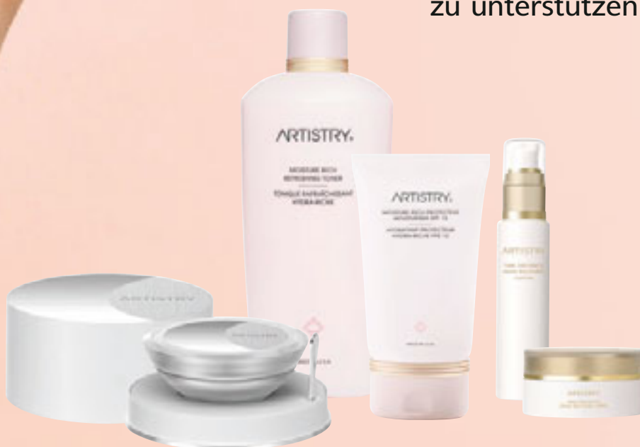
ARTISTRY™ Creme LuXury

Ein toller neuer Verkaufswettbewerb startet im Juli 2008, um Sie bei Ihrem Verkauf der ARTISTRY Hautpflegeprodukte zu unterstützen!