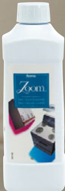
Best.-Nr. 8213 – 1 Liter

* Nicht geeignet für die Benutzung auf glatten Latexflächen, Teppichen und unbehandelten Holzoberflächen.