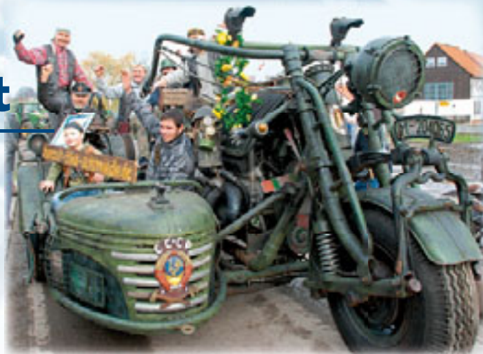
Mit 4,74 Tonnen Eigengewicht das mächtigste Motorrad der Welt

Ein Meilenstein ihrer Arbeit ist ohne Zweifel der Bau eines Riesenmotorrades. Mit 4,74 Tonnen Eigengewicht und einem Hubraum von 38.000 Kubikzentimetern wurde dieser imposante Koloss im November 2007 mit großem Aufsehen für das „Guinness Buch der Rekorde 2008“ gekürt. Hergestellt aus heute unbrauchbar gewordener Technik der ehemaligen russischen Roten Armee soll dieser Gigant in erster Linie als Symbol für die Abrüstung und den Frieden in der Welt stehen. Zahlreiche Fernsehauftritte, Zeitungsberichte und Glückwünsche aus aller Welt folgten und machten