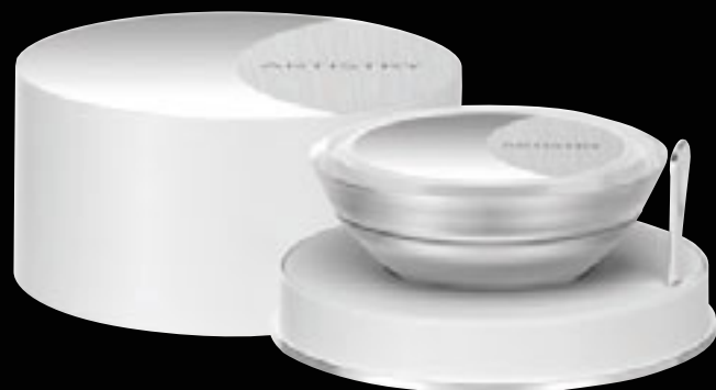
Best.-Nr. 103564 – 45 ml

„Am Anfang dieses Projekts stand der Wunsch, etwas wirklich Einzigartiges zu schaffen, etwas, das schön und ästhetisch ansprechend, gleichzeitig aber auch sehr schlicht ist. Wir haben die Marke in die Zukunft versetzt, und das ist dabei herausgekommen. An dem Produktdesign gefällt mir besonders, dass es sämtlichen Erwartungen widerspricht und völlig neu und frisch wirkt. Die Kombination dieser außergewöhnlichen Creme mit einem raffinierten, eleganten Produktdesign ist mit nichts anderem auf dem Prestige-Kosmetikmarkt zu vergleichen.“