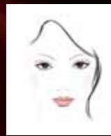
POUDARJEN VIDEZ (Metro Chic)