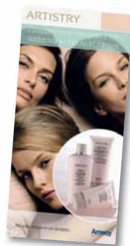
Letak za stranke ARTISTRY™ Št. izdelka: 105466 (1 paket po 10 izvodov)