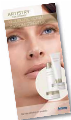
Letak za stranke ARTISTRY™ TIME DEFIANCE™ Št. izdelka: 105469 (1 paket po 10 izvodov)