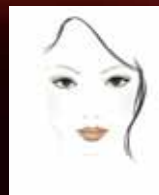
SODOBEN VIDEZ (Urban Chic)

Le do 29. februarja 2008 lahko kupite katerega koli od teh enkratnih izdelkov ter dobite 25 % popusta in polno vrednost TV/VP. Ampak pohitite, ponudba velja le do razprodaje zalog.