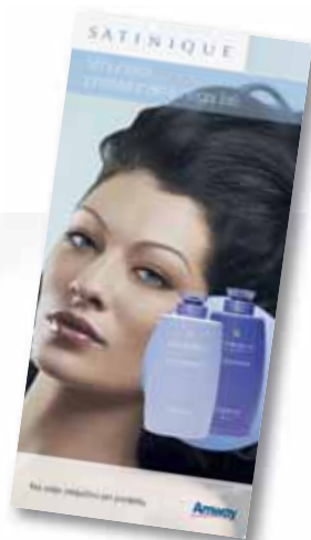
Letak za stranke SATINIQUE™ Št. izdelka: 105470 (1 paket po 10 izvodov)